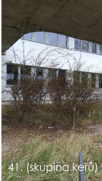
41. (skupina keřů)