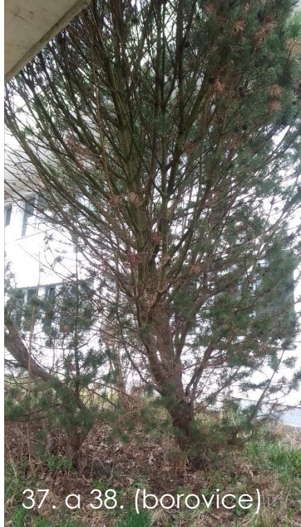
37. a 38. (borovice)