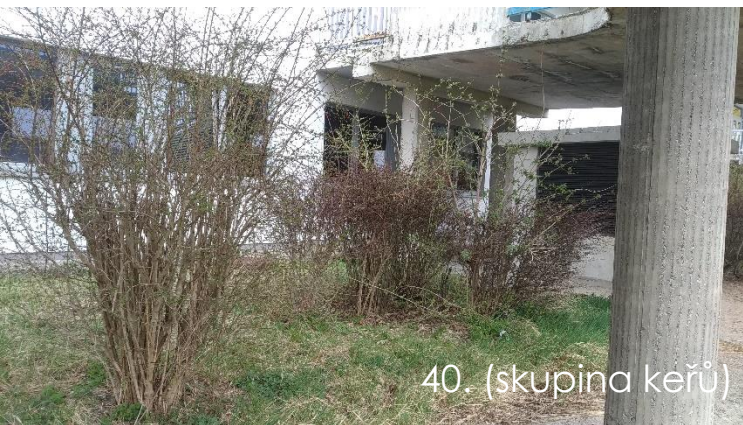
40. (skupina keřů)