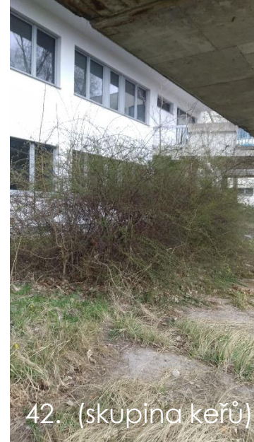
42. (skupina keřů)