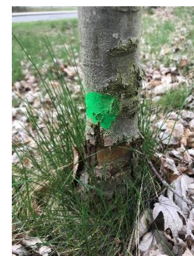
Nové výsadby a),b),c),d),f)