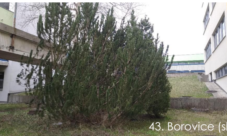
43. Borovice (skupina)