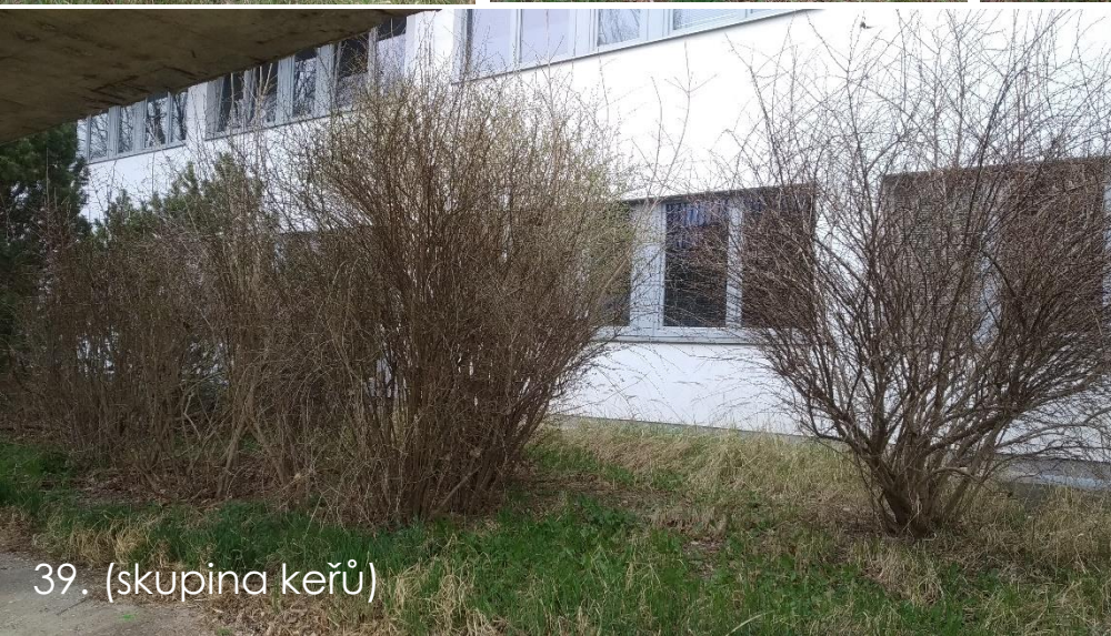
39. (skupina keřů)